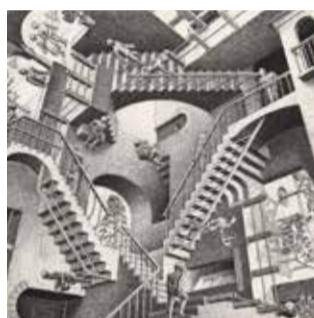
ESCHER NAPOLI , PAN Palazzo delle Arti di Napoli Dal 1 novembre 2018