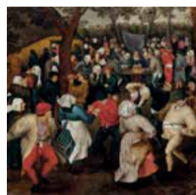
BRUEGHEL HIROSHIMA , Hiroshima Prefectural Art Museum Dall'8 ottobre 2018

Per maggiori informazioni: 06 91511055 - didattica@arthemisia.it