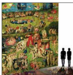
BOSCH, BRUEGHEL, ARCIMBOLDO Una mostra spettacolare PISA , Arsenali Repubblicani Dal 14 novembre 2018