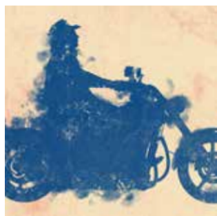
EASY RIDER Il mito della motocicletta come arte TORINO , Reggia di Venaria Fino al 24 febbraio 2019