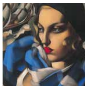
TAMARA DE LEMPICKA Reina del art déco MADRID , Palacio de Gaviria Dal 5 ottobre 2018