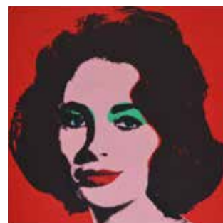
ANDY WARHOL ROMA , Complesso del Vittoriano - Ala Brasini Dal 3 ottobre 2018