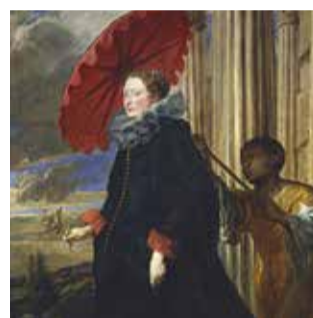
VAN DYCK Pittore di corte TORINO , Galleria Sabauda Dal 16 novembre 2018