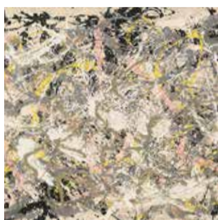
POLLOCK e la scuola di New York ROMA , Complesso del Vittoriano - Ala Brasini Dal 10 ottobre 2018