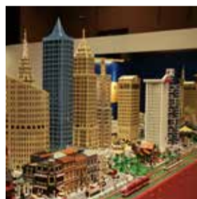
I LOVE LEGO SEUL , Lotte Culture Hall at Lotte Mall Gimpo Airport Branch Fino al 31 dicembre 2018