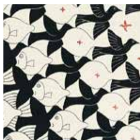
ESCHER LISBONA , Museu de Arte Popular Fino al 16 settembre 2018