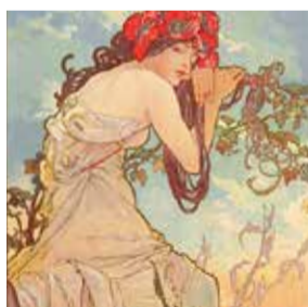
ALPHONSE MUCHA PARIGI , Musée du Luxemburg Dal 12 settembre 2018