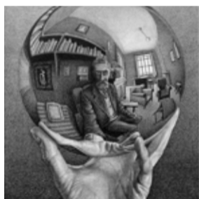
ESCHER. The Exhibition & Experience BROOKLYN, NY , Industry City Fino al 3 febbraio 2019