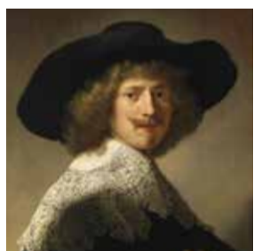
THE AGE OF REMBRANDT AND VERMEER: Masterpieces of the Leiden Collection SAN PIETROBURGO , Museo dell'Ermitage Dal 4 settembre 2018